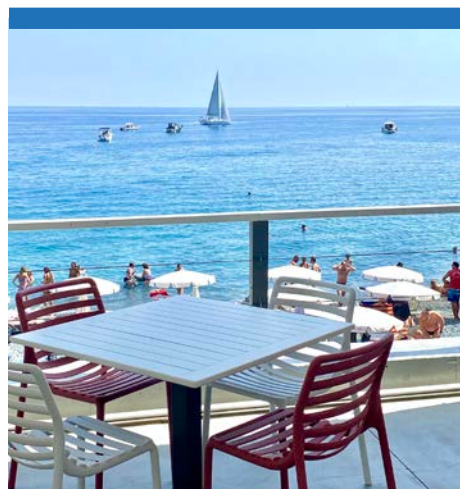
La terrazza fronte mare è una delle 4 possibilità di godersi il Cala Loca